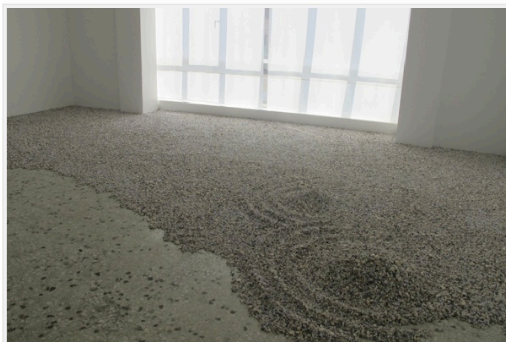
Η εγκατάσταση Κήπος Zen έχει ως εφαλτήριο τον κήπο Daisen-in στο Κυτό της Ιαπωνίας και συγκεκριμένα έναν από τους τέσσερις του ναού που ονομάζεται Ωκεανός και συμβολίζει τον τελικό προορισμό της γαλήνης και της ηρεμίας

Στο πάτωμα απλώνεται η μεταβλητή του εγκατάσταση, το «έδαφος» του μοναστικού κήπου, ένα κομμάτι γης που ανεπαίσθητα φτιάχνει στροβίλους-μικρά υψώματα σε ένα-δυο σημεία στην επιφάνειά του. Νομίζεις ότι ξεβράστηκε ένα κομμάτι πραγματικής θάλασσας μέσα στον κλειστό χώρο αλλά το υλικό του είναι όλο δημιουργημένο, κατασκευασμένο.